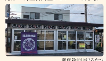
海産物問屋まるかつ

特典 海産物問屋まるかつ 期間中1,000円以上お買い上げで、 ちりめんじゃこ100gのサービス 定休日: 水曜日 (注) 営業時間、定休日は変更となる 場合がございますので、ご来店前に 店舗にご確認ください。 TEL: 0120-813-831